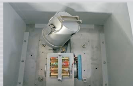
安装 300 cc 容器时